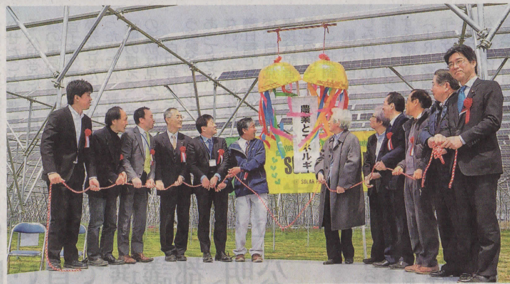
営農型太陽光発電所の完成を祝いくす玉を割る関係者ら＝3日午前、匝瑳市飯塚

同発電所の想定年間発電量 4メガワットアワー。一般電力消費量に相当する。(20年平均)は約1.42家庭約288世帯分の年間